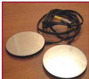
Датчик двигательной активности