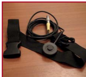
Датчик мимики лица