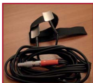
Датчик кожно-гальванической реакции

Компьютерный полиграф «Диагноз-М» предназначен для осуществления психофизиологического метода «детекции лжи» в полевых условиях и применяется в оперативно-розыскной и кадровой работе при опросах с использованием полиграфа для выявления у человека возможно скрываемой им информации.